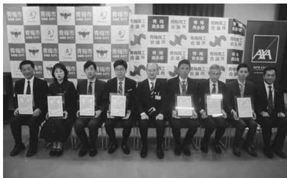
▲ 2025 年度健康経営優良法人 認定企業

去る11月17日（月）に青梅市、アクサ生命保険（株）との共催でおうめ健康経営フォーラムを開催しました。