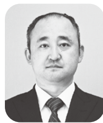
建設・不動産部会長