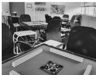
▲「らあめん花月嵐 千ヶ瀬店」の2階にて営業

青梅市で純日本風の民泊を営んでいる古民家リラックスホームが健康マージャンのサロン「麻雀リラッ