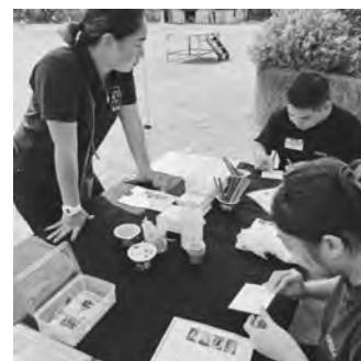
▲ エシカルなものづくり体験

エシカルとは人・社会・地域・地球環境に配慮した活動のことで、当社ではこの考え方に基づいた取り組みを積極的に進めています。例えば、余った木材をまな板に加工、タイルを使ったアート作品制作など、資源を無駄にしない活動を行っています。次の世代へと豊かな環境を繋ぐための取り組みを心がけています。