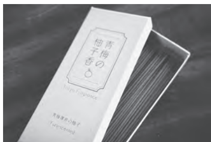
▲青梅の柚子香(1箱約75本入り) 定価: 2,000円(税込)

同社は、青梅市梅郷の梅を使用した「青梅の梅線香」も開発・販売しており、どちらとも同霊園管理事務所の他、まちの駅青梅などで販売しています。