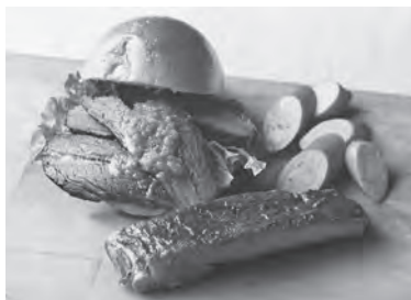
▲ブリケットサンドセット

本格的なバーベキュー料理で人気のB-YARDが、イトインとバーベキュースペースを備えた新店舗を10月21日(火)にオープンしました。