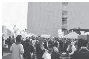
▲ 市役所会場来場者数：12,500人