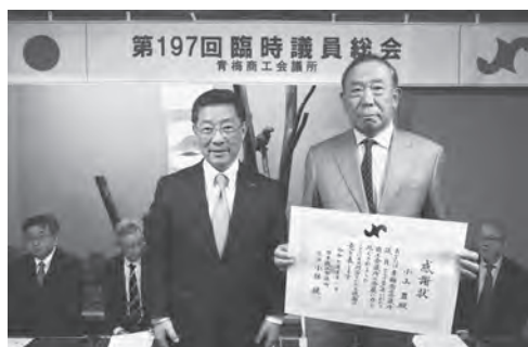
▲ 退任議員を代表して （株）コヤマ小山社長が授与