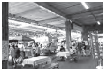
▲ カインズ青梅インター店会場

会場：カインズ青梅インター店 1階資材館入口前 日時：11月29日(土) 10:00～15:00 出店：7店舗