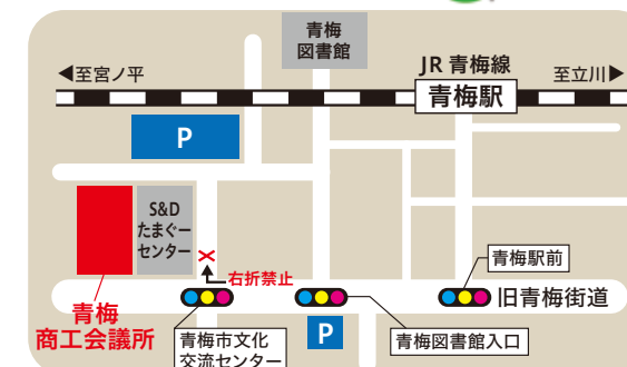
(JR青梅駅から徒歩5分)