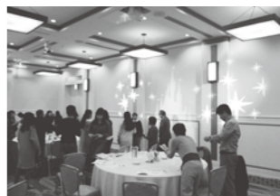
アンバサダーホテルでの研修会の様子

■視察研修「東京デイズニールゾートセミナープログラム『デザインアカデミー』受講」 10月18日(木) 午前中は、アンバサダーホテルにて顧客満足度を創出するサービスについて学び、午後はパークにて、サービスを実践する従業員(キャスト)の視察を行いました。