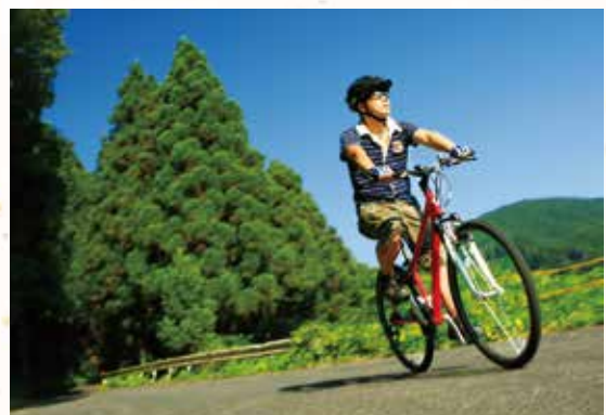
当商品は「だんべ」にて販売

レンタサイクルで東京の豊かな自然を ゆっくりと楽しんでみませんか？ 奥多摩駅徒歩1分のショップで自転車を 借りて、青梅の河辺で返却 OK！