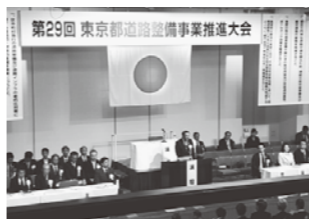
第29回東京都道路整備事業推進大会