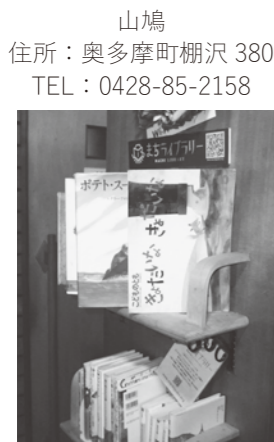
山鳩 住所：奥多摩町棚沢 380 TEL：0428-85-2158