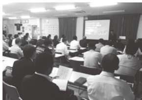
10月10日開催 第4回IoT推進分科会

IoT技術を活用した生産管理システムの開発から実装までの過程で蓄積した「現場発のノウハウ」を市内産業に波及させる体制を整備し、支援することで、青梅市のロボットやソフトウェア等の生産性向上に係るIoT技術を活用した第4次産業革命を推進し、地域内産業における高付加価値の創出を目指します。