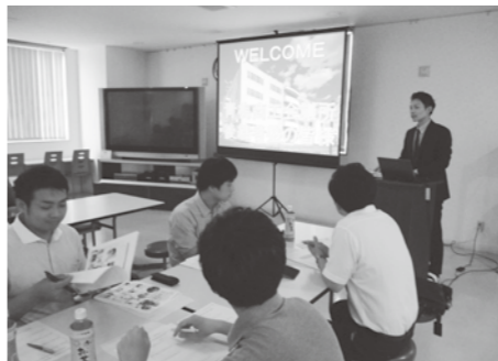
南デザイン(株) 視察の様子

また、工場見学終了後には参加者同士の懇親会を行い、情報交換の場としても、とても有意義な時間を過ごすことができました。