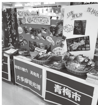
多くの事業所のパンフレットが設置された。

●イトーヨーカドー拜島店で観光PR 【開催期間】7月10日~8月12日 1日6,000人の来店者へ青梅・奥多摩の観光情報と希望されるお店のチラシ等を多くの方にPRしました。