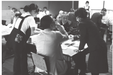
かつお節削り体験の様子

おにぎり試食などができる「味の素川崎工場」の見学会を実施しました。どちらの見学先も大変人気があり、多くの方に参加していただきました。