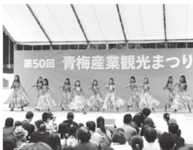
昨年ステージ風景

会場 永山公園グラウンド 主な内容 キャラクターショー、Hugっと!プリキュアショー(多摩ケーブルネットワーク(株)協賛)/ミニOKUTOBERFEST/パラスポーツ体験コーナー/梅郷そば・梅郷スイーツ/ご当地グルメTOKYOX肉うどん/青梅焼まんじゅう等 毎年恒例の食べ物・ショッピング・展示コーナーも多くのお店で賑わいます。詳細は同封のチラシをご確認ください。