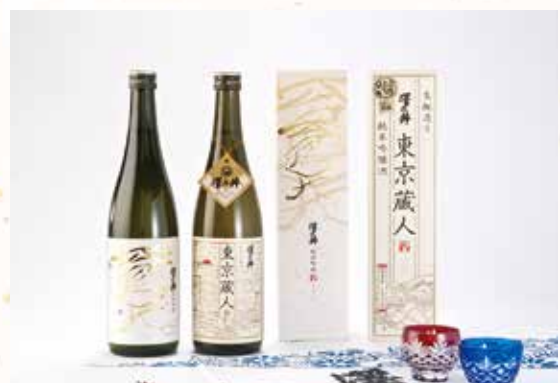
当商品は「だんべ」にて販売

日本酒の魅力をたくさんの人に伝えたい。 こだわって醸したお酒です。口当たりな めらか、程よい酸味です。ぜひご堪能く ださい。