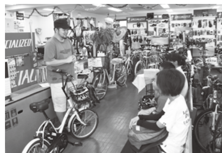
大人向けから子ども向けまで内容は様々