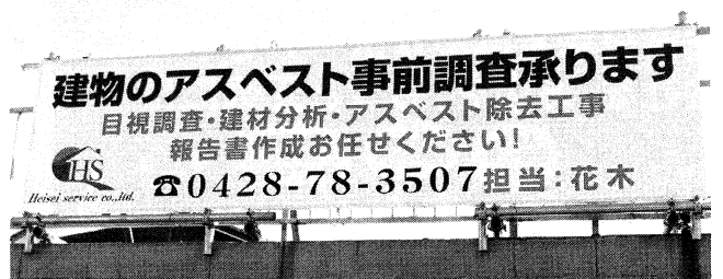
▲アスベスト事業の看板

今後も、当社の業務のニーズに応えながら現状に甘んじず、最近始めたドローン業務のように、常に新たな挑戦をし続けていきます！