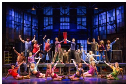
Kinky Boots National Touring Company.

公演日時 2016/10/9(日) 12:30 開演 会場 東急シアターオーブ(渋谷ヒカリエ11階) 価格 S席 13,300円 → 8,000円 販売枚数 10枚 * 申込多数の場合抽選。 枚数制限 会員及び家族の合計人数分 購入方法 同封の申込用紙をご記入の上、FAXにて申込みください。 締切後ご連絡します。 締切日 7/29(金)